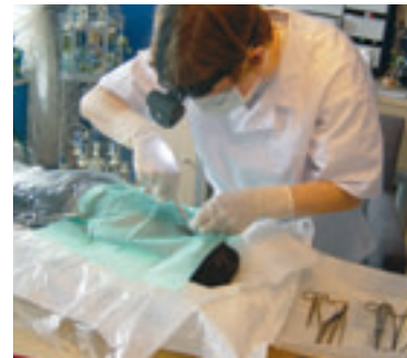
Kleine Chirurgie direkt vor Ort: hygienisch und sicher