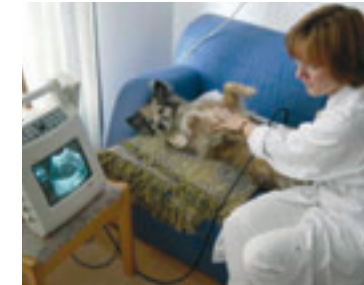
Mobile Einsatzgeräte: da staunen sogar die Patienten.

Unser Praxisfahrzeug ist ein geräumiger Mercedes Vaneo und die gesamte Ausrüstung ist für die mobile Behandlung bei Ihnen vor Ort ausgelegt.